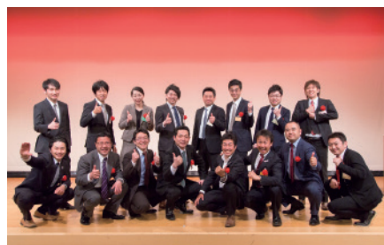
プログラムを経て、16名は、今も支え合い、切磋琢磨する同志になった。