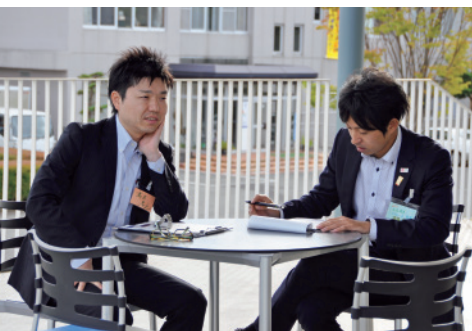
「ペアインタビュー」は、これからの半年間を共にする仲間たちを知る第一歩としても、とても役立った。

「探究」↓「実践」↓「共有」の3段階で「自ら変化を起こす力」を鍛える仕組みを用意 次世代経営者育成プログラムでは、「①自己/チームでの探究」「②現場業務での実践」「③実践の成果と学びを共有」の3段階を1ステップとして、4ステップのプログラムを設計した。ここでは、その各ステップを紹介する(図3)。