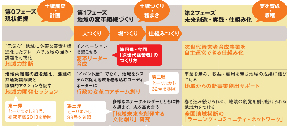
図1 「地域イノベーション研究」全体像

まざまに工夫して、自らの旅館・ホテルの変革、そして周辺地域の変革を実現する力を身につけるところまで含んだプログラムになっている。このプログラムで参加者が行うことは、図2の通りである。