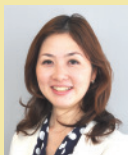
じゃらんリサーチセンター 研究員

後継者は、なりたくてもなれない生まれ持った「運命」。この運命をなんとか、ではなく「自覚的に引き受けるかどうか」で本人の、組織の、地域の、業界の未来は変わっていく。地域は脈々と続く事業者が多い。このプログラムが全国で自主開催され、未来を力強く創る変革リーダー&事業者のネットワークが更に溢れることを目指し、支援し続けたい。